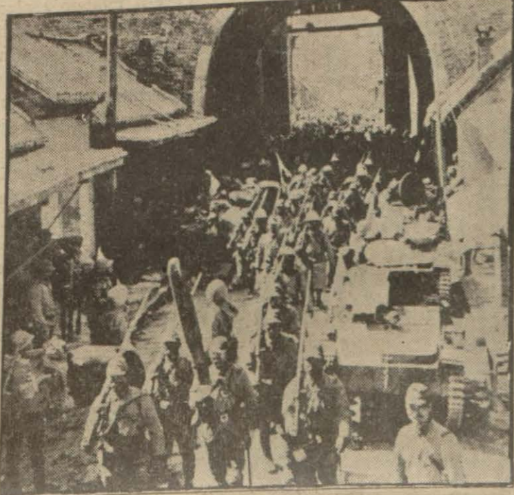
Cebheye giden askerlerden bir grup

Londra 28 (Husus) — Sarinehrin sol sahiline geçmiş olan Çin kuvvetleri, Lunghay demiryoluna karşı yeni bir hücumla başlamışlardır. Çin kuvvetleri Şarka doğru ilerliyerek Kayteng şehrine varmışlardır.